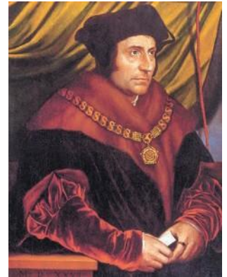
Santo Tomás Moro

Santo Tomás Moro (1478-1535) fue un pensador, teólogo, político, profesor de leyes, juez de negocios civiles, abogado, humanista, traductor, poeta y escritor inglés. Buen esposo y padre de cuatro hijos. Su obra más famosa es Utopía , donde describe la organización de una sociedad ideal.