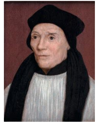
San Juan Fisher

San Juan Fisher (1469-1535) fue un obispo muy santo: atendía su diócesis, administraba los sacramentos, visitaba los enfermos, daba limosnas a los pobres y era muy hospitalario. Además, llevaba una vida muy austera, sólo dormía cuatro horas, y durante las comidas, tenía ante sí una calavera que le acordaba de la muerte. El joven rey Enrique VIII, hijo de Enrique VII, decía que ningún otro reino tenía un obispo tan distinguido como Juan Fisher. Paradójicamente el mismo rey sería su verdugo.